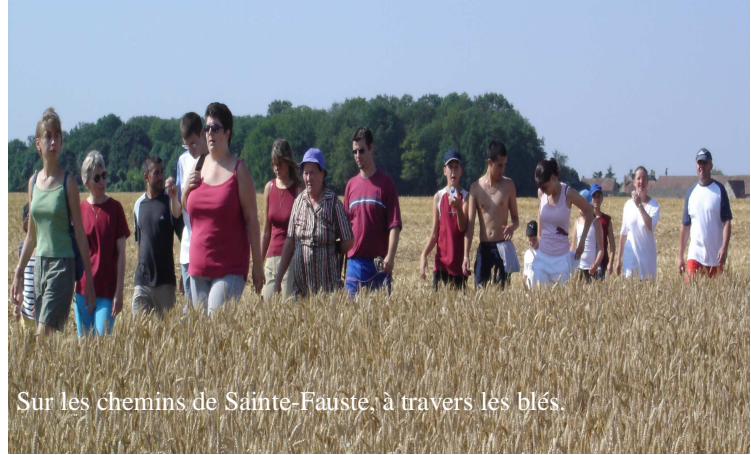
Sur les chemins de Sainte-Fauste, à travers les blés.

Rendez-vous habituel du début d'été à Sainte-Fauste, la randonnée pédestre organisée par la mairie s'est déroulée cette année sur une partie de la commune que tous ne connaissaient pas. En effet, le parcours nous a emmené derrière la Tripterie jusqu'aux communaux. Cette partie de la commune est en limite de celle de Neuvy-Pailloux.