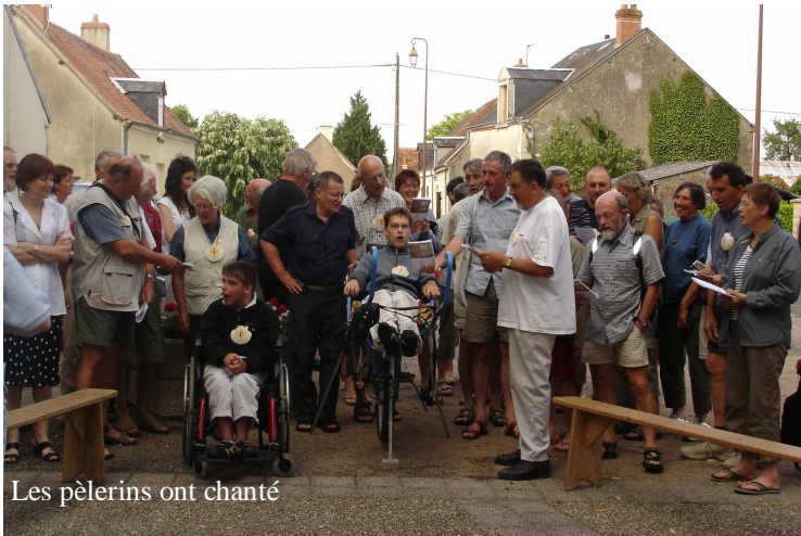
Les pèlerins ont chanté

Les pèlerins ont chanté et rechanté pour nous remercier.